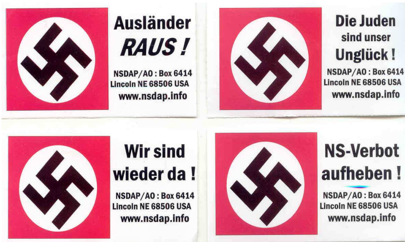
Abb. 1 – NSDAP/AO-Aufkleber